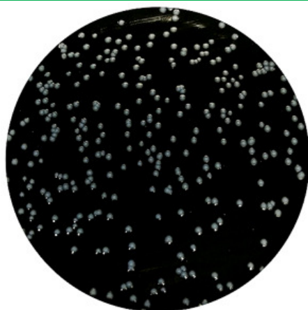
Colonie di Legionella pneumophila